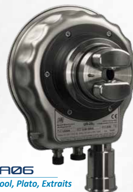
BA06 Alcool, Plato, Extraits