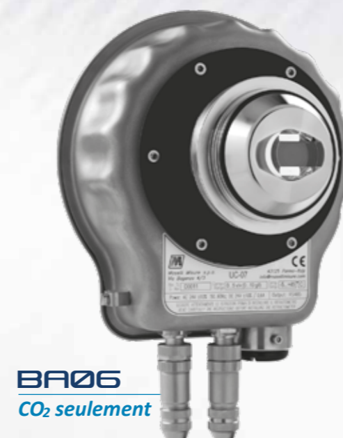
BA06 CO 2 seulement

Ainsi, les capteurs peuvent être facilement connectés aux récepteurs MP01 ou MP02 conçus pour une interface conviviale. Il n'y a pas de pièces mobiles dans l'équipement, le rendant ainsi très robuste et pratiquement sans entretien: aussi, les nouveaux capteurs optiques de CO 2 basés sur le principe infrarouge ATR réduisent les coûts de maintenance comparé à un analyseur traditionnel.