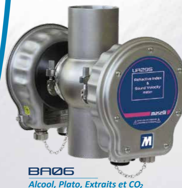
BA06 Alcool, Plato, Extraits et CO 2