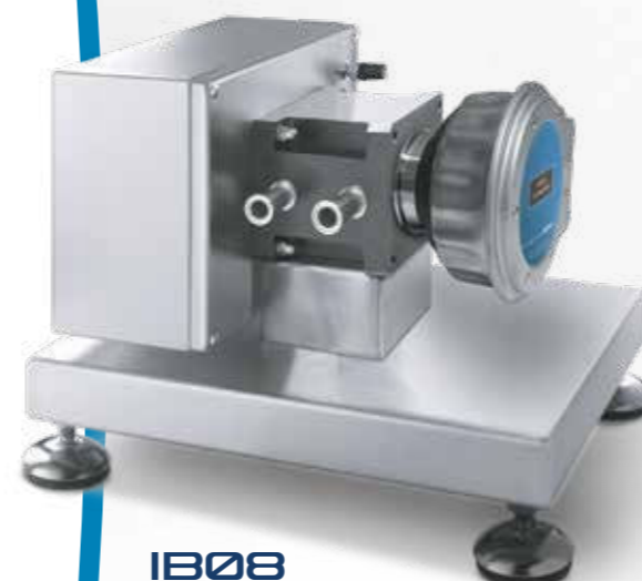
IB08 Brix-Diet CO 2 IR