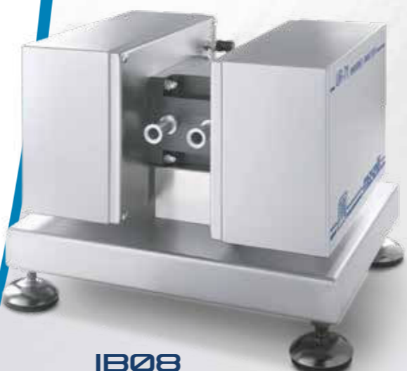
IB08 Brix-Diet CO 2 P/T